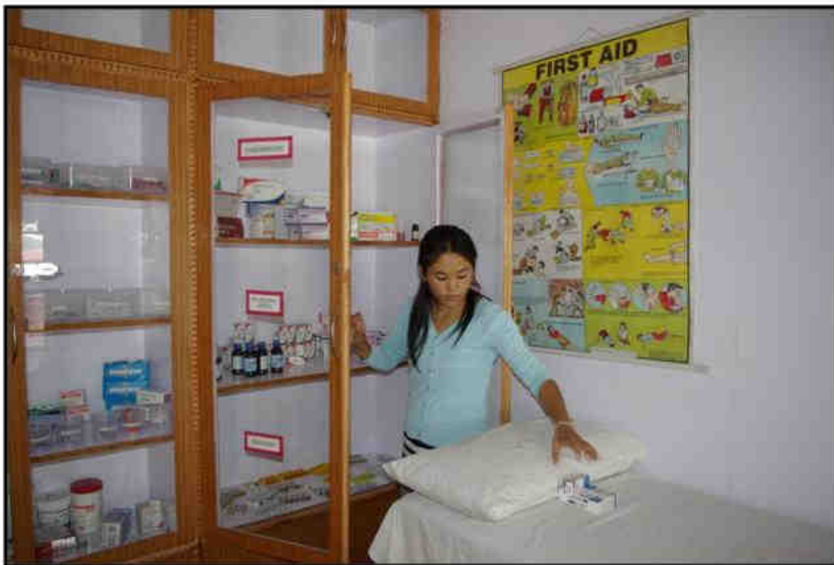
Darované léky jsou pečlivě uschovány