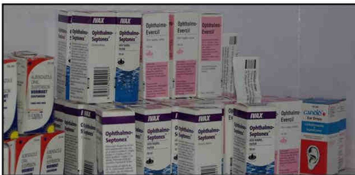
Kapsle již našly své místo v lékařském středisku