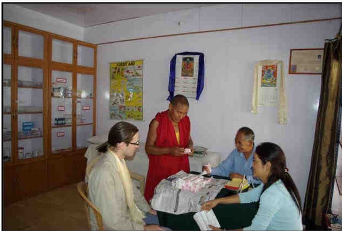
Předávání kapiček v medicínském středisku tradičnímu tibetskému lékaři a jeho dceři, doktorce farmacie západní medicíny