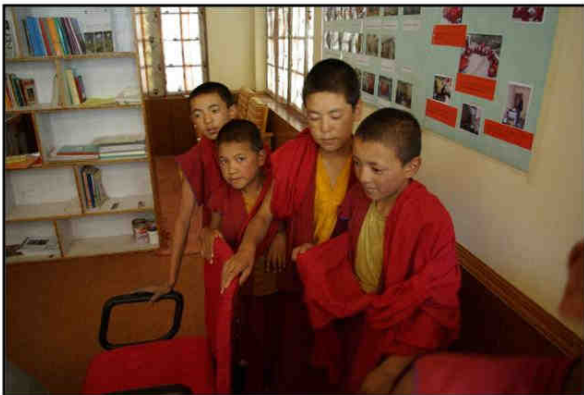
Mnišci čekající na ošetření