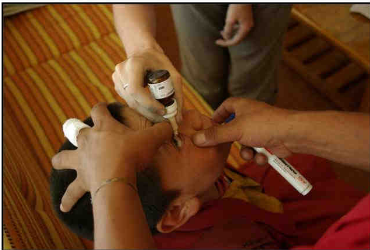
Kapky pomáhají už i v severoindickém klášteře Diskit